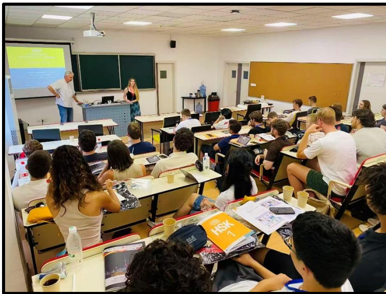
Vortrag in den Räumen des CDHK in der Tongji-Universität

Diese Vielfalt an Perspektiven zog sich durch die gesamte Summer School. Ob in den Vorträgen zur chinesischen Außenpolitik, zur Rolle der Wirtschaft oder zu gesellschaftlichen Entwicklungen – uns wurde nichts vorenthalten.