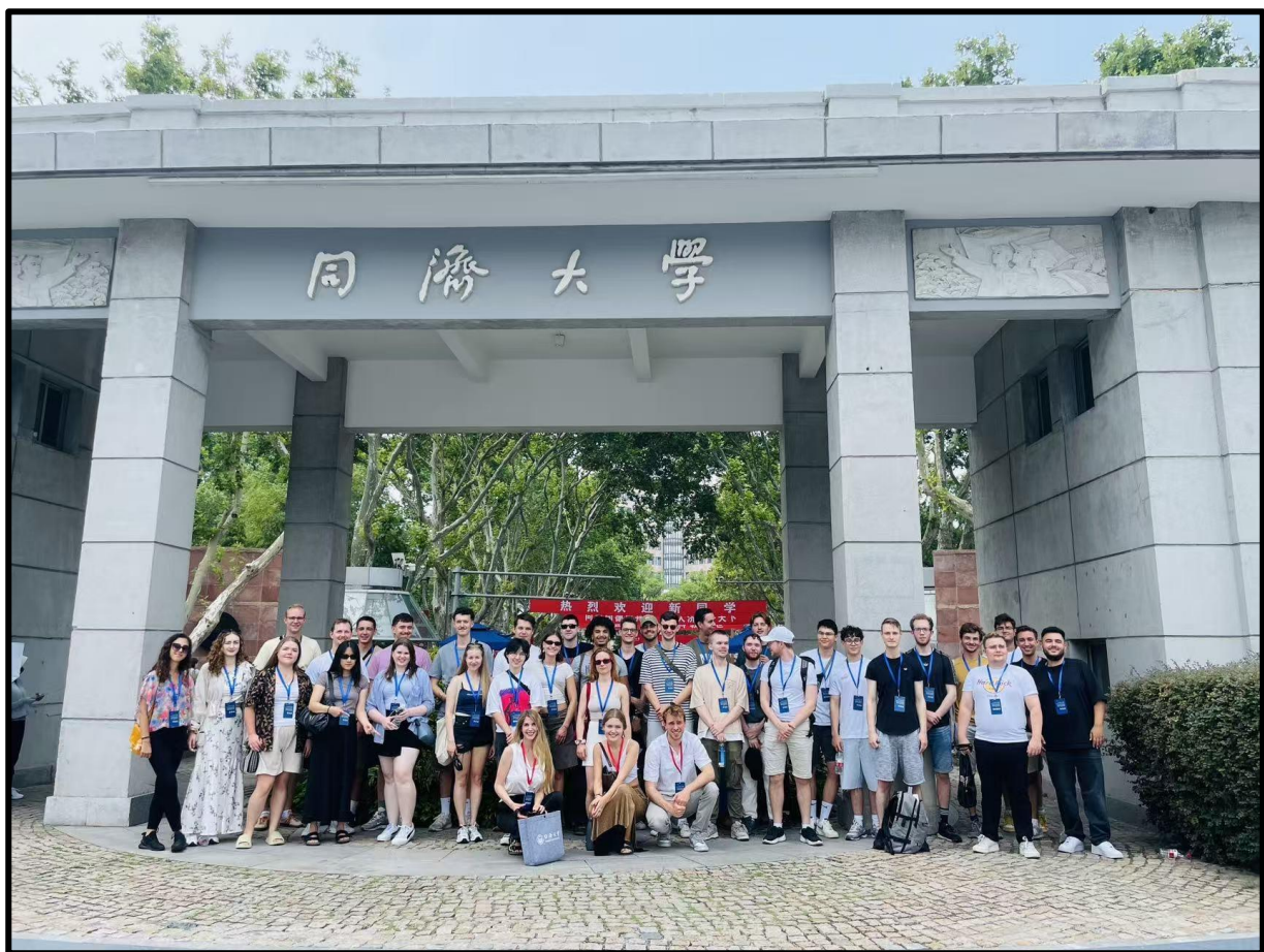
Alle Teilnehmer vor den Eingangstoren der Tongji-Universität

Obwohl China mich dadurch nicht für viele weitere Besuche reizt, so war die Summer School für mich doch ein Anstoß, mich künftig intensiver mit Chinas Politik, Wirtschaft und Gesellschaft auseinanderzusetzen.