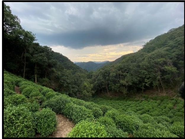
Blick auf die Longjing-Teefelder

Ein deutlicher Kontrast zur Megametropole zeigte sich auf den Exkursionen ins Umland. In den ländlicheren Regionen wurde ein spürbarer Wohlstandsunterschied deutlich. Hier spiegelte sich eher die wohl durchschnittliche Einkommenssituation der Bevölkerung wider. Dennoch war es beeindruckend zu sehen, welchen Entwicklungssprung China in nur wenigen Jahrzehnten vollzogen hat – von einem Land mit verbreiteter Armut zu einer Nation mit wachsender globaler Präsenz.